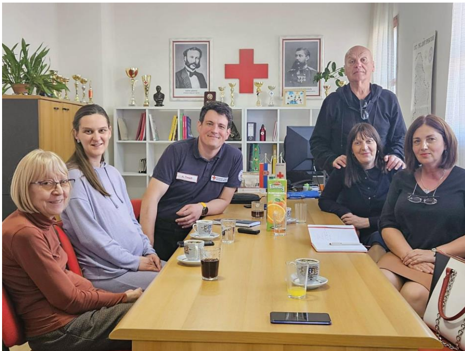
Комисија за прву помоћ Црвеног крста Ваљево

13.09.2024.године обележен је Светски дан Прве помоћи- ученици су са својим наставницима обележили у школском дворишту кроз показну вежбу за ученике првог и другог разреда, а на централном Градском тргу ученици одељења 2/1 демонстрирали су кардиопулмоналну реанимацију одрасле особе, адолесцента и бебе заинтересованим суграђанима, као и употребу аутоматског спољашњег дефибрилатора. Реализован је час прве помоћи у ОШ „Милован Глишић”.