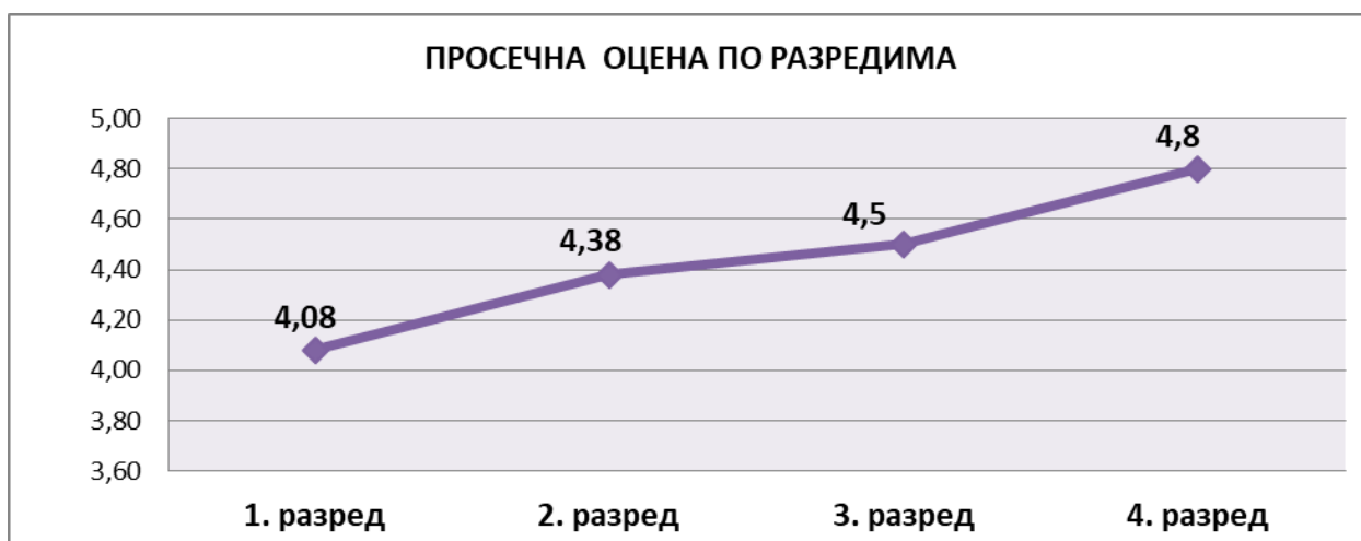
Слика 1. Графички приказ просечних оцена успеха ученика четворогодишњих образовних профила по разредима