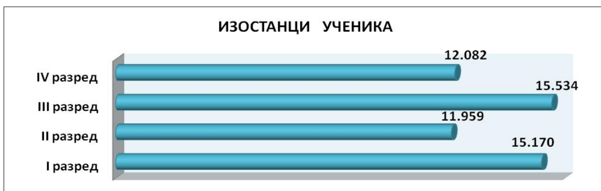
Слика 2. Графички приказ укупног броја изостанака ученика по разредима у шк. 2023-2024.

Ове школске године је знатно увећан број изостанака у односу на прошлу 72,85, а сада 85,14. Оно што можемо да приметимо је да су ученици другог разреда направили најмање изостанака, а највише ученици трећег разреда који су увећали број изостанака и у односу на прошлу годину када је било 69,35, а сада 97,09 по ученику. Ученици првог разреда су ове школске године значајно више изостајали 77,40, док је прошле године просек изостанака по ученику био 63,74. Смањен број изостанака у односу на прошлу годину једино је уочен у другом разреду за 3,45 изостанка по ученику. Сматрамо да је број изостанака велики и у наредној школској години, ПП служба ће у сарадњи са одељенским старешинама припремити план рада и праћења редовности ученика у наставном процесу, а у циљу смањеног броја изостајања.